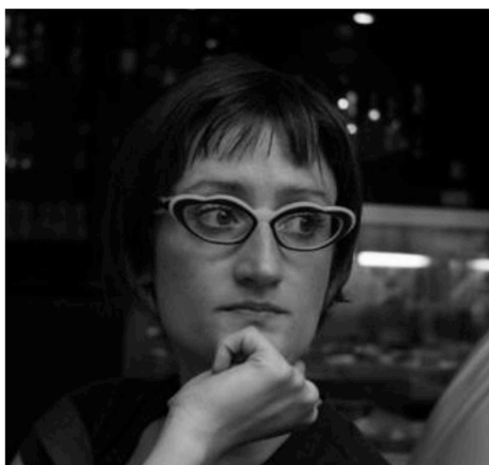
JEWELS DESIGNER Greccio_ Rieti